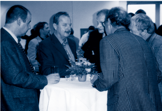
Erfahrungsaustausch für die Praxis

Die Oberflächentage mit stets über 500 Teilnehmern haben sich zu einem wichtigen Forum des Informationsaustausches zwischen Anwendern, Forschern und Entwicklern etabliert. Gegenseitige Information und gemeinsame Diskussion bilden die Basis für zukünftige Entwicklungen. Die Praxisorientierung der Tagung ist für all jene von Bedeutung, die sich mit Entwicklung, Konstruktion, Design und Fertigung befassen. Es ist deshalb vornehmliches Ziel der Oberflächentage 2002, verstärkt zur Vernetzung von Forschung und Praxis auf dem Gebiet der Oberflächentechnik beizutragen und der branchenübergreifenden Kommunikation zunehmende Aufmerksamkeit zu widmen.